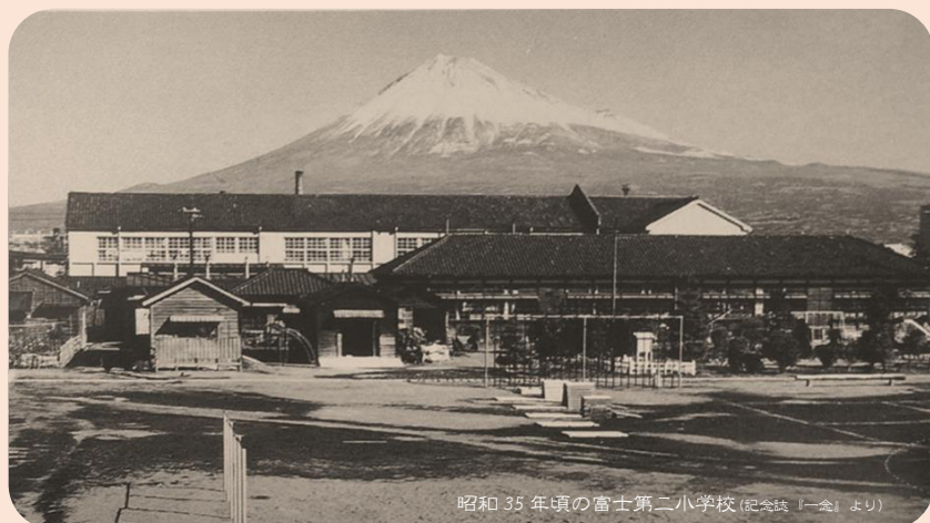
昭和 35 年頃の富士第二小学校 (記念誌「一会」より)

富士市内の小学校 27 校の校歌や校章などから、 富士山に対する意識をご紹介します。