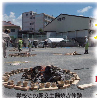
学校での縄文土器焼き体験