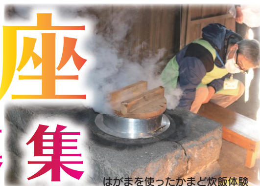
はがまを使ったかまど炊飯体験

富士山かぐや姫ミュージアムで、博物館の活動をスタッフとともにおこなう博物館ボランティアの養成講座受講生を募集します。