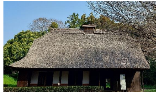
メイン会場は旧稲垣家住宅

わらで編んだ丸い「さん俵（さんだわら）」と人形を作って、流しびな作りに挑戦しよう。