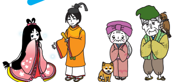
ふじかぐちゃん （赫夜姫）