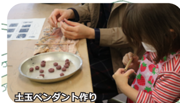
土玉ペンダント作り