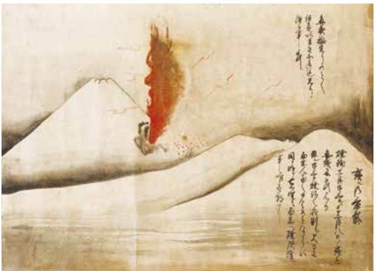
④ 夜ルの景気 宝永4年(1707) 個人蔵