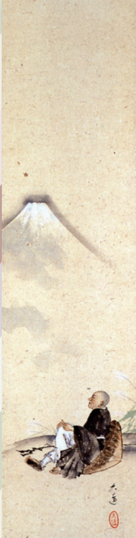
久遠 富士見西行図 (当館蔵)