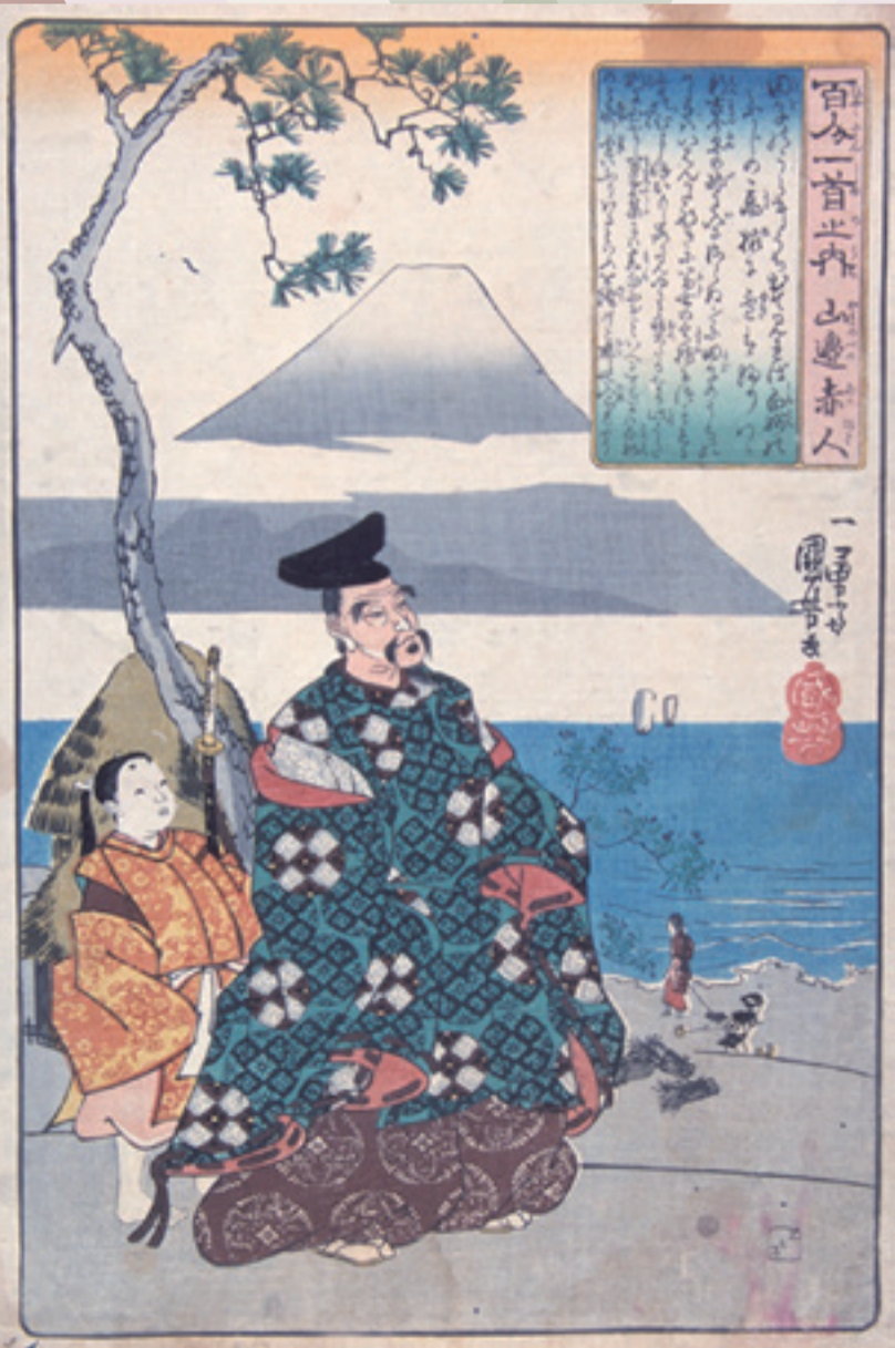
歌川国芳 百人一首之内 山邊赤人 江戸時代 (当館蔵)

遠い都で綴られた『竹取物語』や『伊勢物語』などの物語、『万葉集』などの和歌集の中には、富士山周辺を舞台とした説話や歌が見られます。そしてそれらを題材として描かれた作品は、時代を越えて人々に愛され、今に伝えられています。 本展示会では、物語や和歌の世界を描いた浮世絵、絵画、版本などを紹介します。富士をキーワードに、千年前の平安時代に思いを馳せてみてはいかがでしょうか。