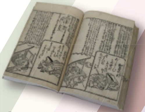
『百人一首像讚抄』(部分) 天和3年(1683) (富士文庫蔵)