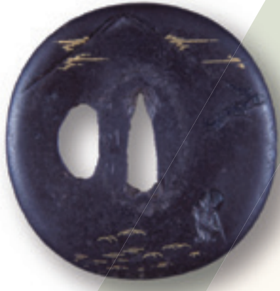
富士見西行図 鐺 (当館蔵)