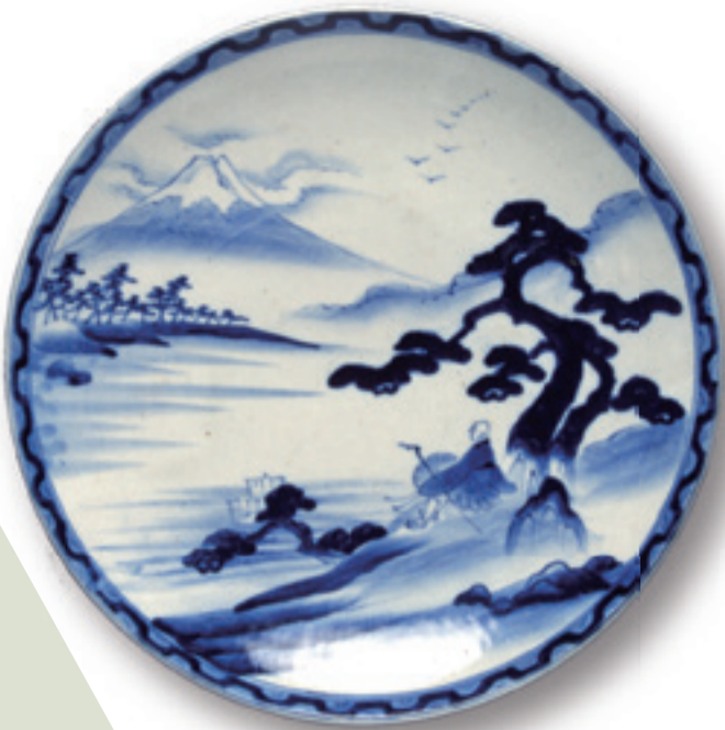
染付富士見西行図 大皿 (当館蔵)