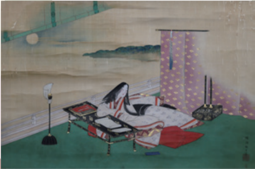
晴海雅言 紫式部観月図 (当館蔵)