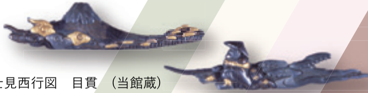
富士見西行図 目貫 (当館蔵)