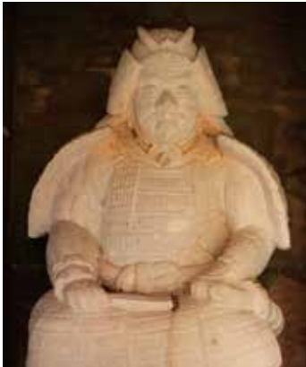
③ 古郡神社に祀られている古郡文右衛門像 近代 日野神社蔵(越前市向新保町)※パネル展示