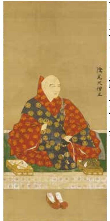
② 隆光大僧正像(部分) 享保10年(1725)護国寺蔵