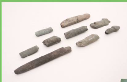
子どもがたくさんできますように (富士市 浅間林遺跡出土石棒類)