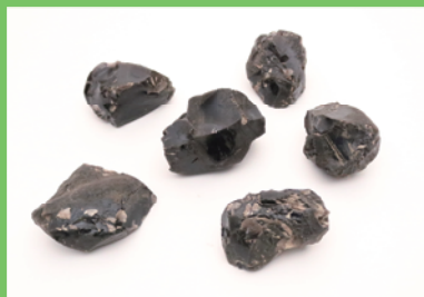
黒曜石が長野からきたぞ！ (富士市 谷津原古墳群出土)