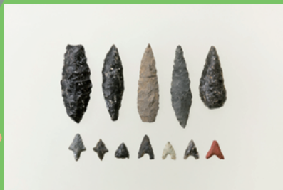
いろいろな狩りアイテム (富士宮市 大鹿窪遺跡出土尖頭器・石鏃)

この展示会では、東西・南北を結ぶ街道を通じて発展した富士・富士宮地域の縄文人の生活を解説しながら、その知恵や工夫を紹介していくから、ぜひ見に来てね！