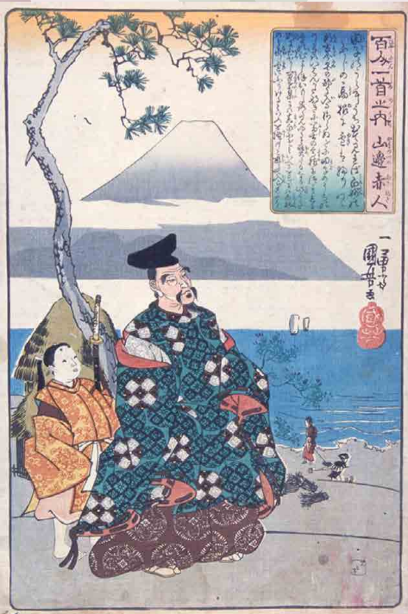
歌川国芳 百人一首之内 山邊赤人 江戸時代

遠い都で綴られた『竹取物語』や『伊勢物語』などの物語、『万葉集』などの和歌集の中には、富士山周辺を舞台とした説話や歌が見られます。そしてそれらを題材として描かれた作品は、時代を越えて人々に愛され、今に伝えられています。 本展示会では、物語や和歌の世界を描いた浮世絵、絵画、版本などを紹介します。富士をキーワードに、千年前の平安時代に思いを馳せてみてはいかがでしょうか。