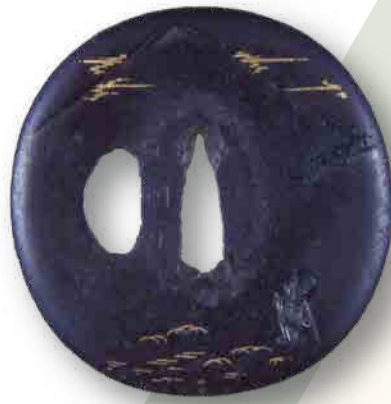
富士見西行図 鐺 (当館蔵)