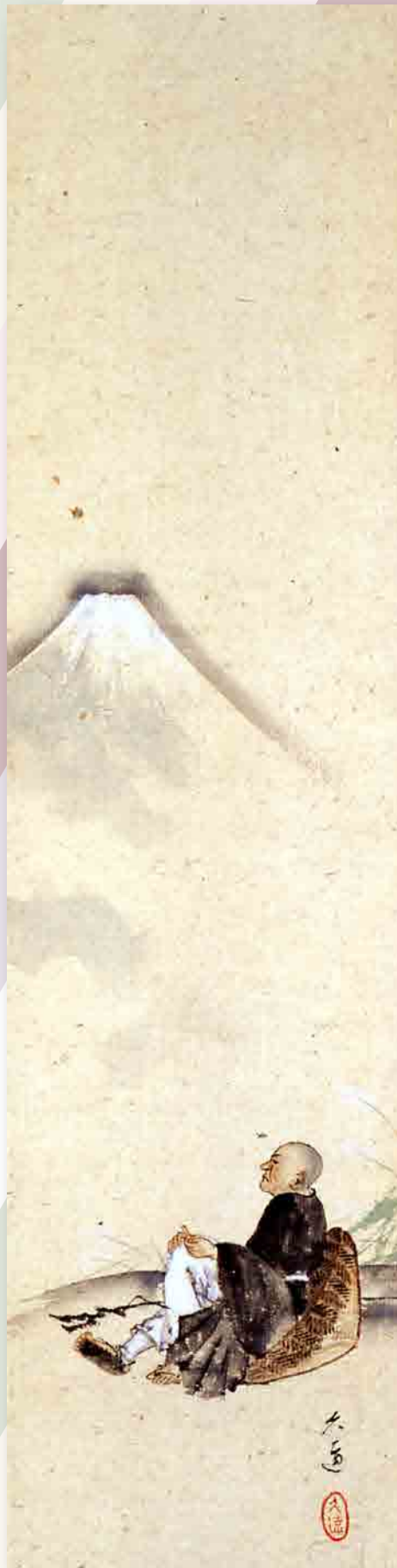
久遠 富士見西行図 (当館蔵)