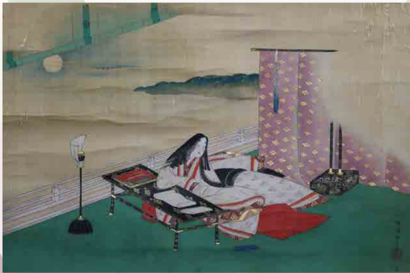
晴海雅言 紫式部観月図 (当館蔵)