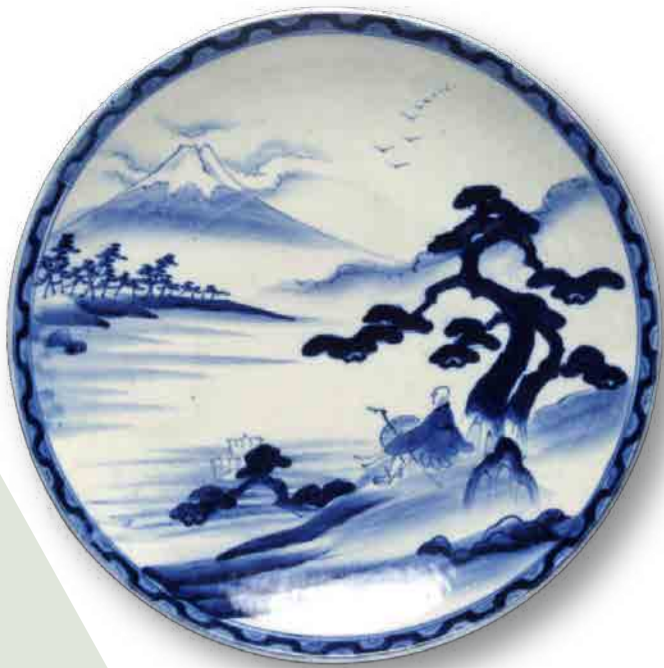
染付富士見西行図 大皿 (当館蔵)