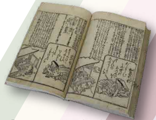
『百人一首像讃抄』(部分) 天和3年(1683) (富士文庫蔵)

遠い都で綴られた『竹取物語』や『伊勢物語』などの物語、『万葉集』などの和歌集の中には、富士山周辺を舞台とした説話や歌が見られます。そしてそれらを題材として描かれた作品は、時代を越えて人々に愛され、今に伝えられています。 本展示会では、物語や和歌の世界を描いた浮世絵、絵画、版本などを紹介します。富士をキーワードに、千年前の平安時代に思いを馳せてみてはいかがでしょうか。