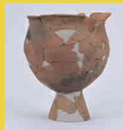
だいつきがめ 台付甕 みやぞえ いせき 宮添遺跡 (富士市)