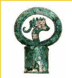
たんほうかんとうた ち つかがしら 単鳳環頭大刀柄頭 芝荒 2 号墳 (沼津市)