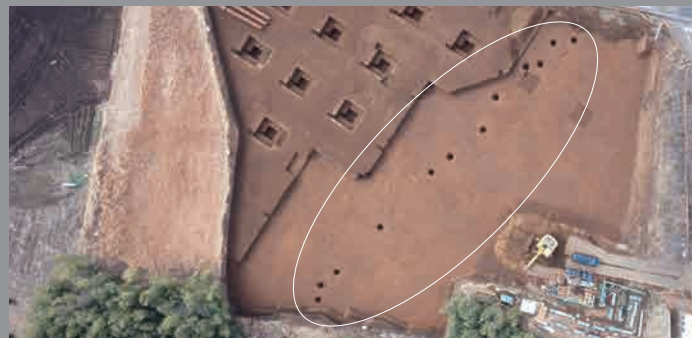
おと あなれつ ふ じいしせいせき ながいずみちよう 陥し穴列 / 富士石遺跡 (長泉町)