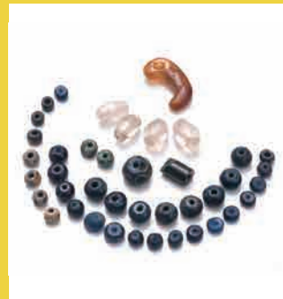
たまらい 玉類 まがたま きりこ だま くだま まるだま こだま (勾玉、切子玉、管玉、丸玉、小玉)