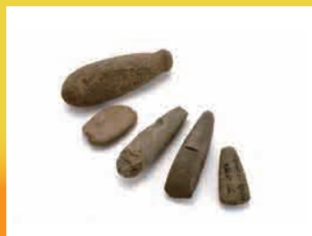
ゆうとうせきすい うちかきせきすい ま せいせきふ 有頭石錘・打欠石錘・磨製石斧 みねやま いせき 峰山遺跡 (富士市)