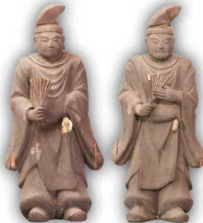
伝虎御前使用の鏡、木造曾我五郎立像、木造曾我十郎立像 曾我八幡宮(富士市厚原)蔵