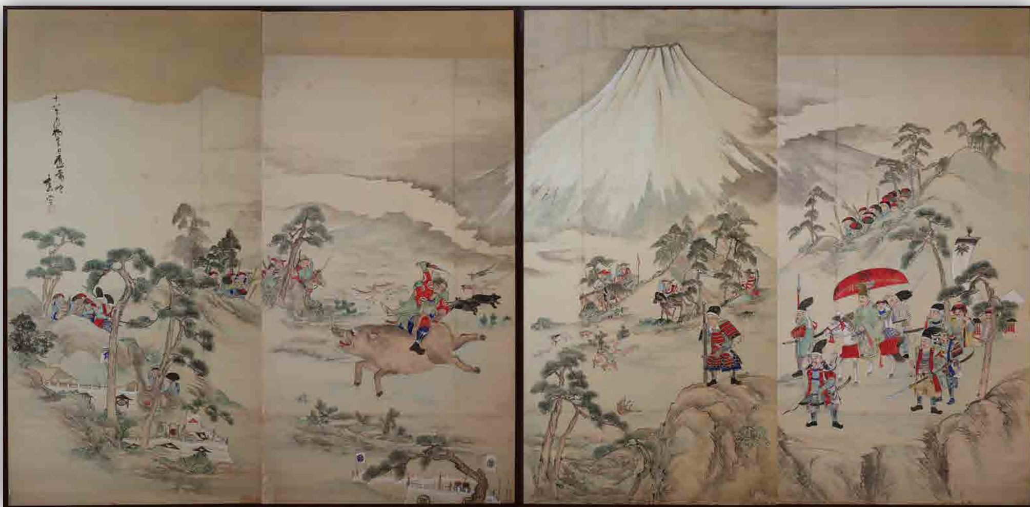
富士の巻狩図屏風 個人蔵

今回の展示では、平安時代から鎌倉時代へ歴史が大きく動いたとき、私たちの住む「富士のふもと」はどのような状 況下に置かれ、また、後世の人々がそのできごとをどのように伝えてきたのか、ゆかりの資料とともに紹介します。 伝説の地を巡りながら、当時の情景に思いをはせてみてはいかがでしょうか。