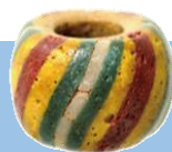
富士市国久保古墳出土 ガラス玉(雁木玉)

私達の住む富士市では、多くの遺跡から装飾品が発見されています。遺跡からでる装飾品の中には色を塗ったものもあります。原始・古代の人々が身につけた装飾品を紙で作って原始・古代人になってみましょう。