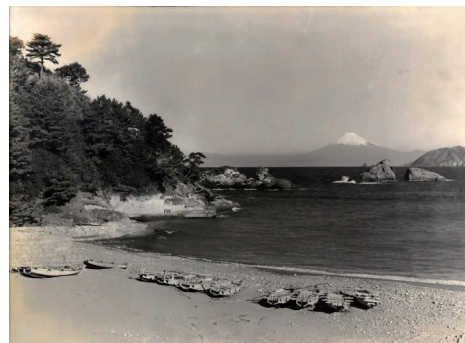
「雲見の海岸」昭和9年(1934)静岡県松崎町