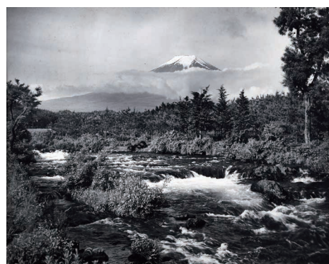
「桂川の清流」昭和11年(1936)山梨県富士吉田市