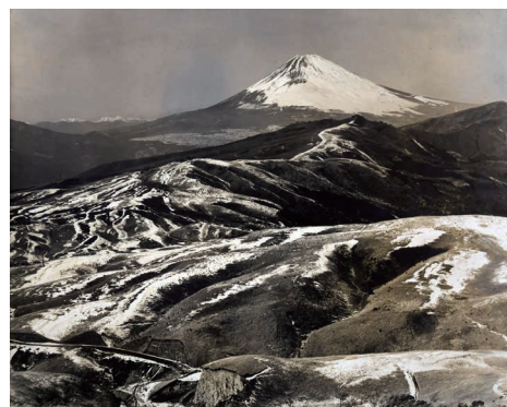
「箱根鞍掛山より」昭和14年(1939)神奈川県箱根町